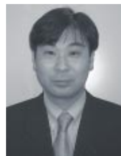
1966年生まれ。1990年早稲田大学商学部卒業。同年、株式会社富士総合研究所入社。同社の会社合併により現在に至る。PFIや指定管理者などの自治体側アドバイザー業務を担当。

これらの諸課題を乗り越えて、指定管理者制度の導入によって民間ノウハウの活用がどの程度進むのかは、これからの指定手続きの結果を待つことになるが、少なくとも現段階において外郭団体の危機感は大きなものとなっている。今後、外郭団体は民間企業と同じ土俵の上で競争をしていくことが求められることから、経営効率化に向けた取り組みを始める団体も見られ、官製市場全体の効率化がさらに一歩進もうとしている。