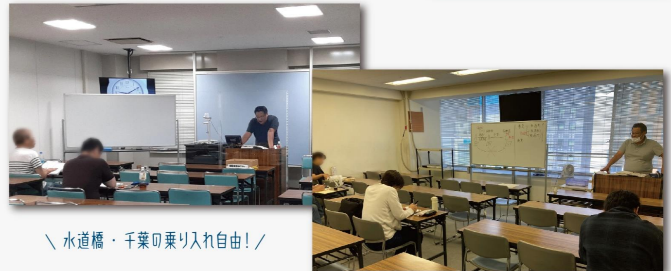
水道橋・千葉の乗り入れ自由！